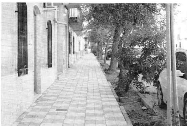
Embaldosado de un 40 % de las calles de Villatorres.