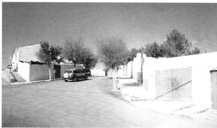
Asfaltado de un 40 % de las calles de Villatorres.