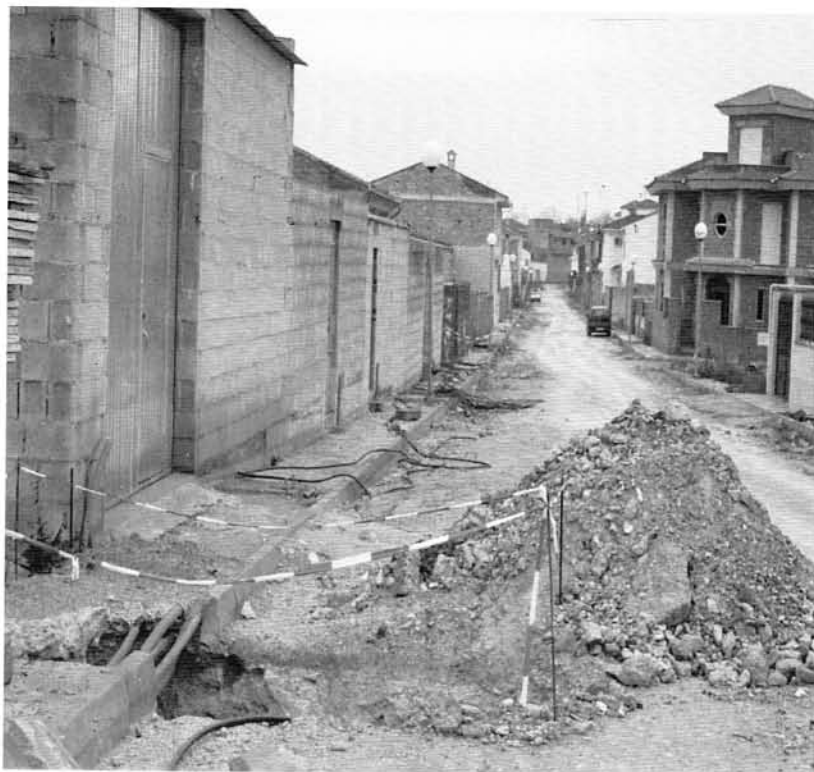
Llano de la Viña: Fase de electrificación.