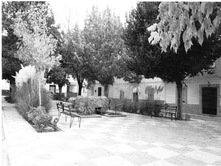
Reforma, mantenimiento y limpieza de zonas verdes. Torrequebradilla

3) En cualquier caso la Contribución Especial se pondrá al cobro unavez finalizadas todas las obras por el Ayuntamiento , y una vez que los vecinos dispongan del 100% de todos los servicios, tal y como establece la Ley. Previamente, cada vecino dispondrá de un balance del Gasto que se ha producido.