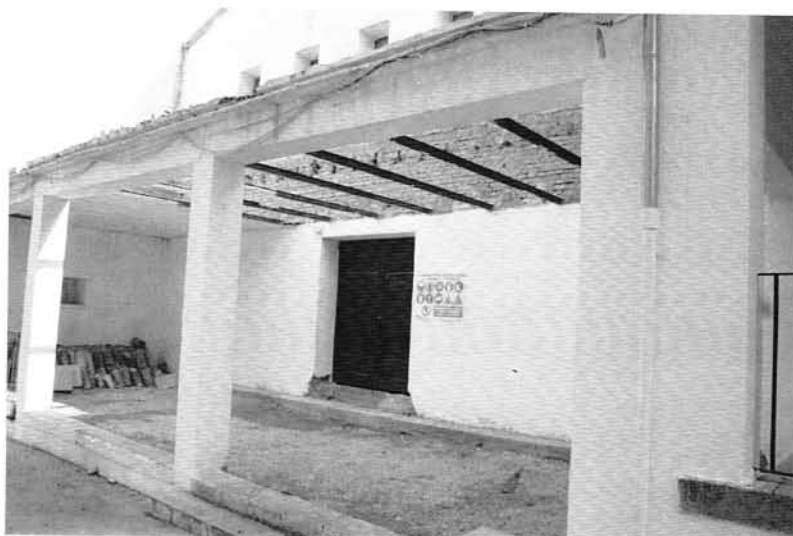
Adaptación de Cine a nuevo Centro Cultural de Vados de Torralba

2) Una vez hechos los trabajos previos, se licita el Proyecto de Ejecución, que por la premura en el tiempo, se hizo por el procedimiento de Negociado. Así se le explicó al Pleno y se pidió disculpas por no poder hacer lo previsto inicialmente.