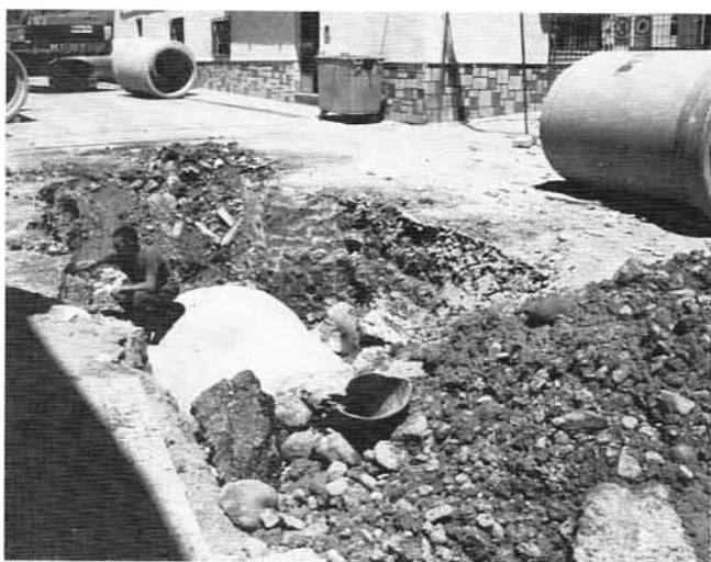
Terminación de Red de Desagües de Alto Caudal. ( Desde Centro de día hasta final de la calle Ramón y Cajal)