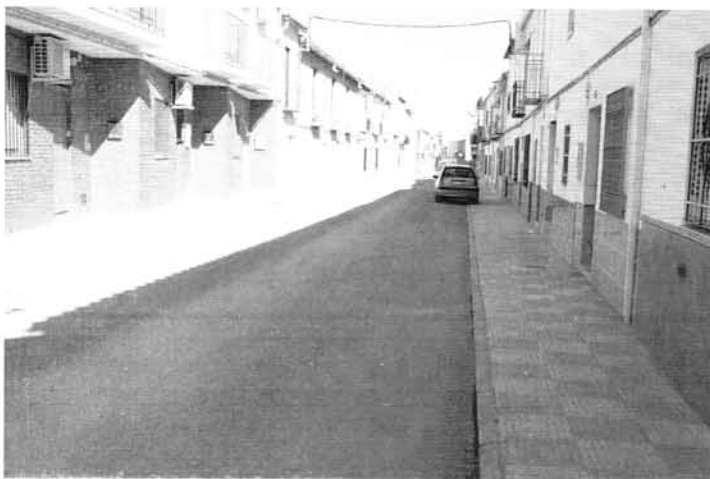
Asfaltado de un 40 % de las calles de Villatorres.