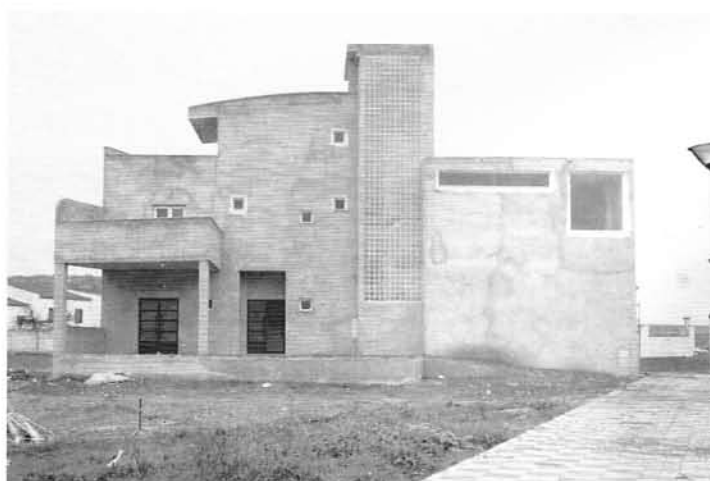
Nuevo Edificio Cultural de Villargordo.