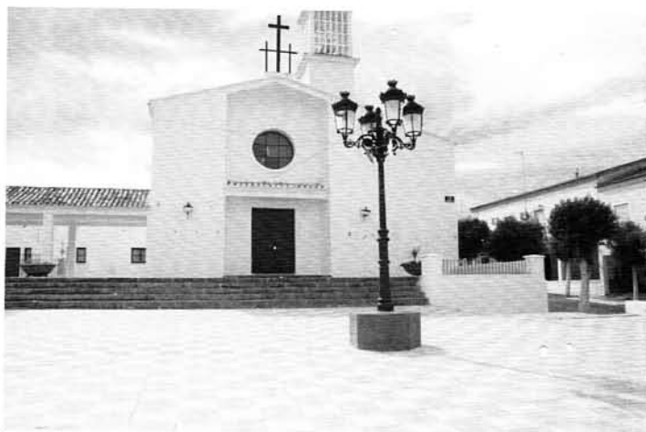
Reforma, mantenimiento y limpieza de zonas verdes. Vados de Torralba