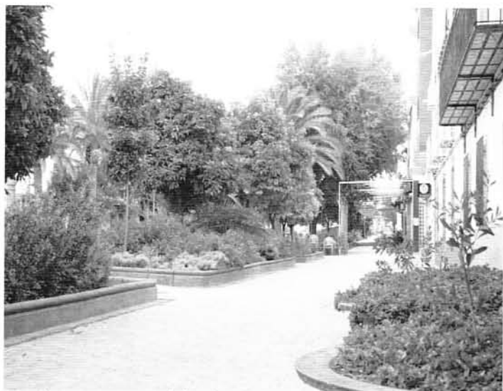
Reforma, Mantenimiento y limpieza de zonas verdes y parques del colegio de Villargordo.