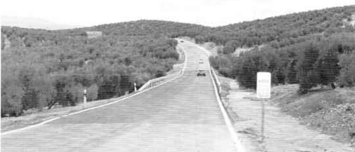
Nuevo arreglo de la carretera: Villargordo -Torrequebradilla.