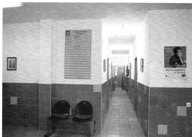
Nuevo Centro de Salud.

3) Actualmente y según información del Sr. Delegado de Agricultura, nuestro Proyecto ha sido seleccionado por la Junta de Andalucía y nos lo van a atender en dos fases y no en tres como creíamos. La primera fase supone una inversión de 1.600.000,00 €. aproximadamente, con una subvención de 1.000.000,00 €. a fondo perdido y una segunda fase de 1.000.000,00 € con 600.000,00 €. de subvención. Para ello los técnicos han tenido que adaptar el Plan de actuación en obra y en contribución especial. En coordinación y siguiendo las pautas de la Administración para evitar posibles problemas a la hora de actuar.