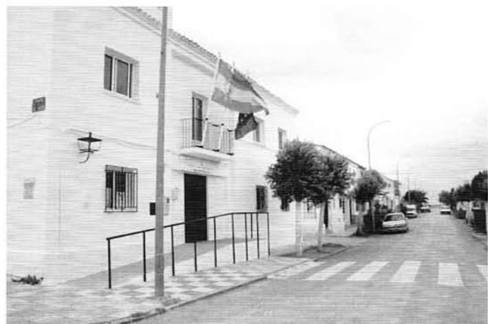
Readaptación del Edificio Socio - Cultural de Vados de Torralba.