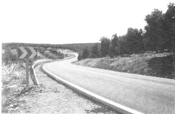
Reforma de Pavimentación Carretera Villargordo - Infantas.