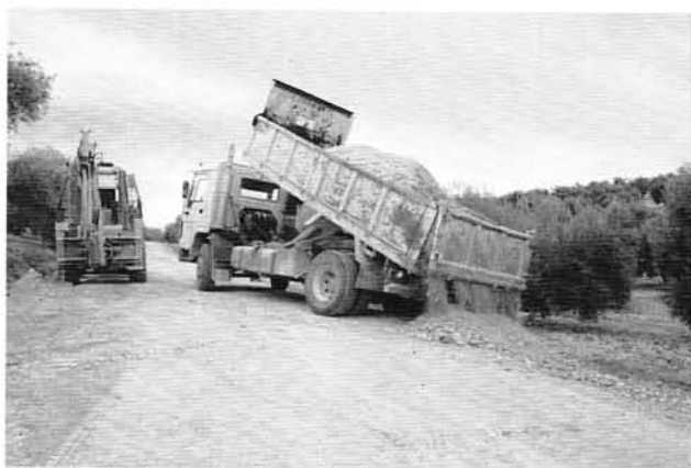
Mantenimiento de Red de Caminos.

Nuevas Dependencias, reformas de las actuales. "Mejor Escuela" Planteándose Proyecto de Actuaciones. Actualmente se está redactando el Proyecto en la Junta de Andalucía.