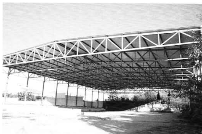
Pista Cubierta Polideportiva.