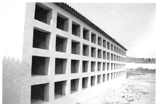
Construcción de 130 nichos.