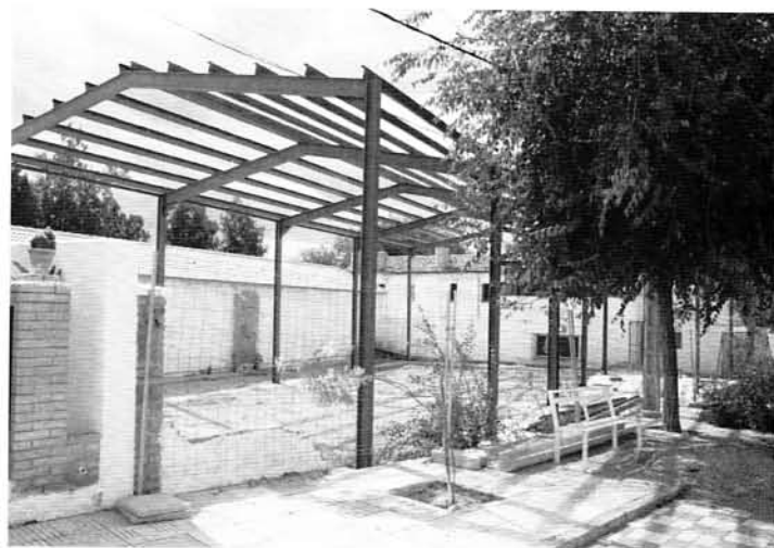
Gimnasio en Colegio de Torrequebradilla.